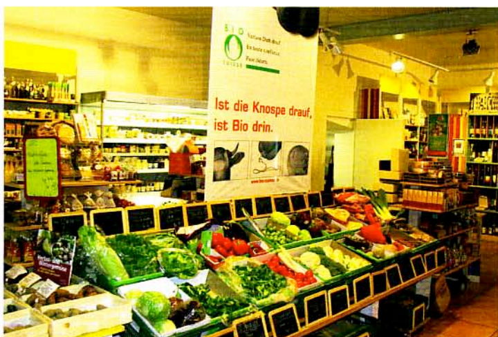
Mit dem Kauf von biologischen und «fairen» Produkten fördern wir die nachhaltige Entwicklung.

onskassen, aber auch Einzelkundinnen und -kunden stärker darauf achten, dass ihre Gelder nur noch dort angelegt werden, dann hätte das eine sehr grosse Wirkung auf die reale Wirtschaft, also auf die Politik der Unternehmensführungen.