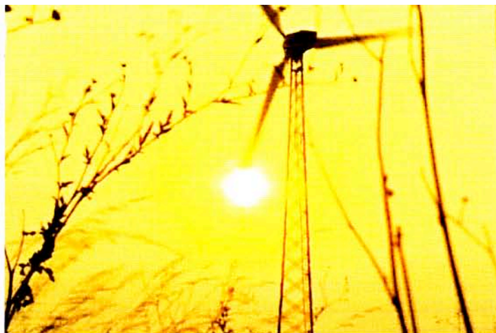
Verantwortungsbewusste Firmen produzieren mit erneuerbaren Energien.