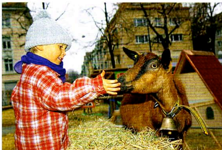
Bauernhoftiere kennenlernen am NATUR-Festival 2006.